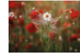
2. Platz 2024: Johanna Burosch